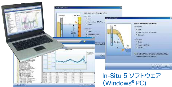
In-Situ 5 ソフトウェア (Windows®PC)