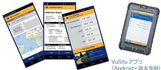
VuSitu アプリ (Android™ 端末専用)

設定項目がイメージしやすいユーザーインターフェイス。メモリ・バッテリー容量もインジケータで確認。ログデータは Microsoft® Excel 形式等に変換出来ます。