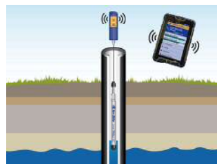
Wireless TROLL Comでの通信イメージ