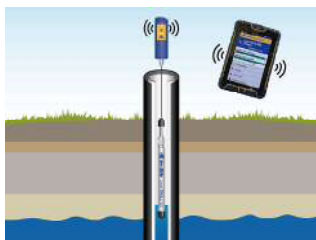
Wireless TROLL Com での通信イメージ