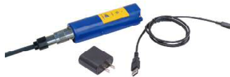
Wireless TROLL Com