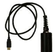
TROLL Com ケーブルコネクタ