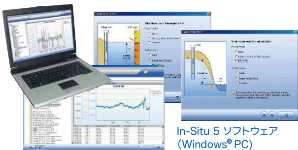
In-Situ 5 ソフトウェア (Windows® PC)