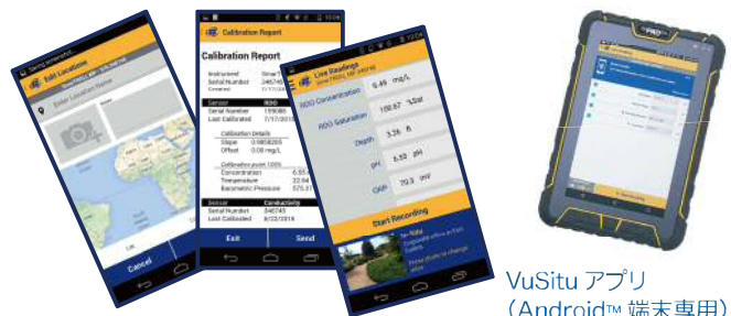
VuSitu アプリ (Android™ 端末専用)

設定項目がイメージしやすいユーザーインターフェイス。メモリ・バッテリー容量もインジケーターで確認。ログデータは Microsoft Excel 形式等に変換出来ます。