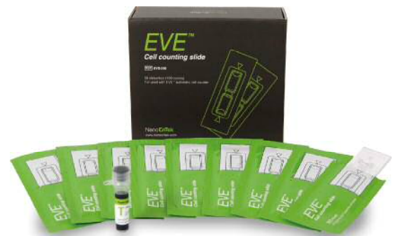
EVEカウンティングスライド